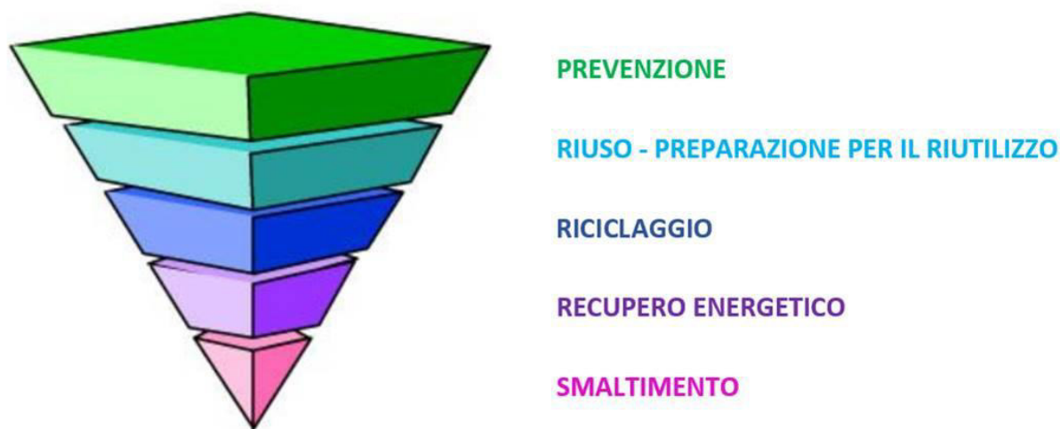
Figura 1: Gerarchia comunitaria di gestione dei rifiuti

In relazione alla produzione totale dei rifiuti urbani si registra nel 2019 un leggero calo rispetto alla base-line di Piano, ma si è ancora distanti dal raggiungimento degli obiettivi previsti al 2020. Questa evidenza, anche in relazione alla grande fluttuazione delle variabili economiche per effetto dell'emergenza COVID-19, necessita di riflessioni approfondite rispetto alla valutazione dei nuovi obiettivi di prevenzione.